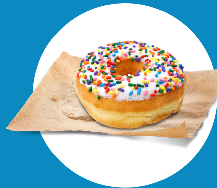
Use pañuelos desechables